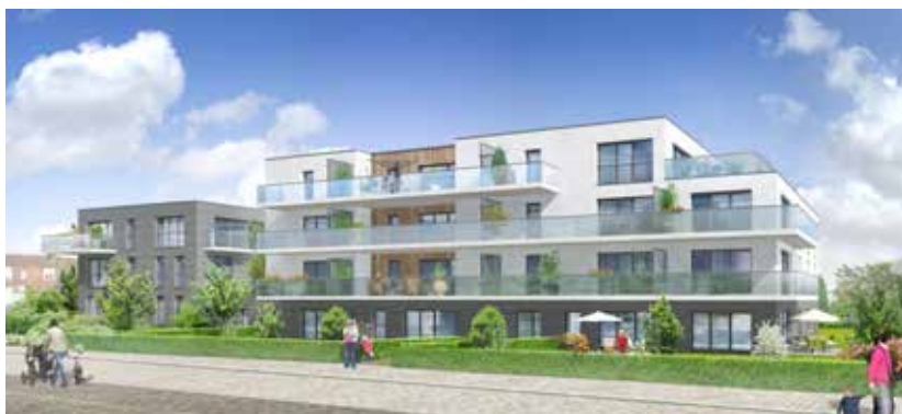
Programme «Le jardin de Claire» à Mons-en-Baroeul

Nous participons également à un appel d'offres en conception-réalisation de logements associé à une maison d'accueil spécialisée.