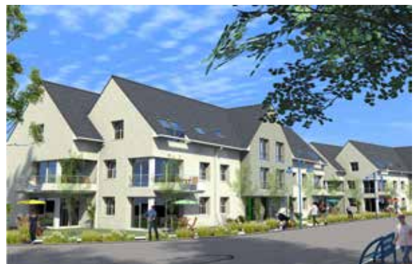
Logements à Annay sous Lens

Maitre d'ouvrage : Projectim Maitre d'oeuvre : Architecte Boyeldieu-Dehanne